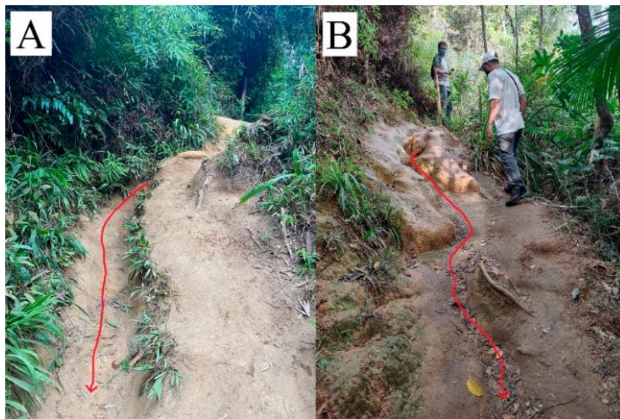
Figura 2 – Pontos de coleta de solo na Trilha da Pedra que Engole (A) e na trilha da Piscina Natural do Caixa D’Aço (B).

Amostras de solo foram coletadas em quatro pontos, dois em cada trilha, em profundidades entre 0 e 20 cm em pontos estratégicos: em locais do leito das trilhas onde há feições erosivas, ou seja, áreas que sofrem pisoteio, e aquelas áreas imediatamente adjacentes (borda) ao trilhas, onde há não há passagem de visitantes (Figuras 2 e 3). Portanto, foi possível inferir o impacto do pisoteio humano e comparar espacialmente a qualidade do solo.