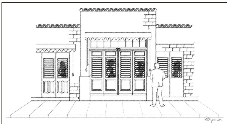
Figura 02: Reprodução das vitrines na Zona de Baixo Meretrício do Bom Retiro, São Paulo, Brasil (1939-1953)