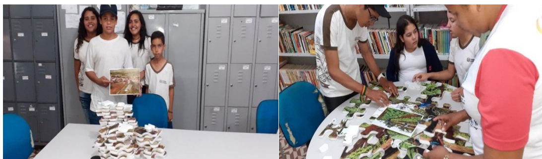
Figuras – Sequência da experimentação do jogo em sala de aula

A mediação do jogo como recurso didático pedagógico, referente ao tema espaço geográfico (fig. 9, 10, 11,12,13 e 14), tendo como tema “O jogo quebra-cabeça do Espaço Geográfico do Semiárido”, ocorreu na biblioteca da escola por uma questão de espaço, pois a sala de aula da turma do 7º ano era insipiente tendo em vista que esta é uma sala de aula improvisada. Para dar início a montagem do quebra-cabeça foram apresentadas à turma as regras a serem seguidas. Na sequência a turma foi dividida em 4 grupos, cada grupo recebeu uma imagem referente a imagem do jogo que seria montada, a escolha de cada imagem aconteceu por sorteio. Em seguida cada grupo ficou diante da sua imagem e peças a serem montadas.