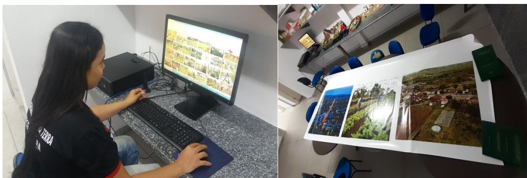
Fig.3 e 4 – Pesquisa no Laboratório - CHS

A produção do jogo pedagógico “O quebra-cabeça do espaço geográfico do Semiárido” foi realizado fora do contexto escolar sendo este produzido no contexto acadêmico no Laboratório de Ciências Humanas e Sociais da Licenciatura em Educação do Campo (fig. 3 e 4). As imagens foram escolhidas a partir de pesquisa na internet. Logo após a escolha das imagens deu-se início à procura de uma gráfica que pudesse fazer a formatação da arte modelo de quebra-cabeça sobre as imagens.