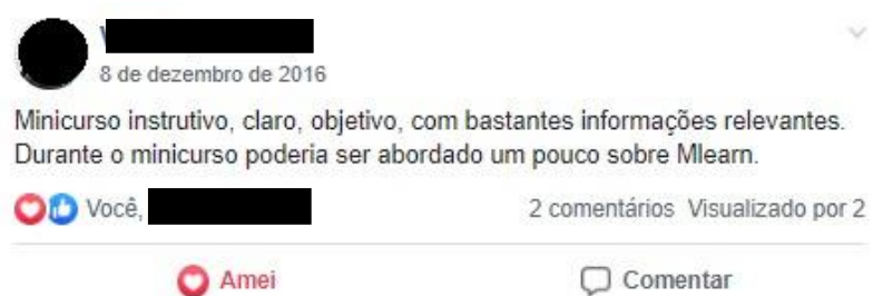
Figura 1A - Feedback no grupo do Facebook

Segundo Okada et al (2012, p.2), a interação que se dá nas mídias sociais com a partilha dos dados é essencial, pois