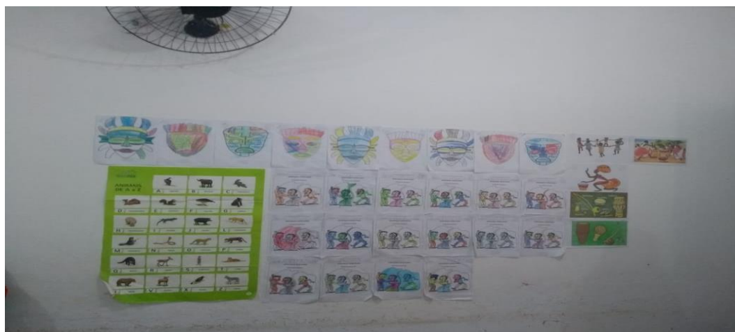
Figura 03- Atividade na parede da sala de aula.