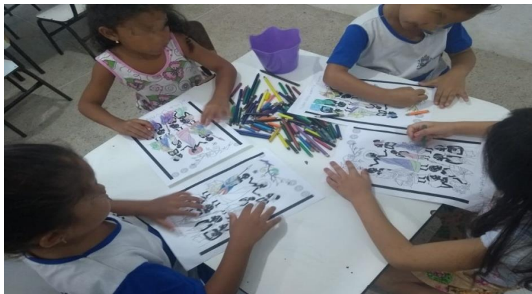
Figura 01–Crianças desenvolvendo atividade de releitura.