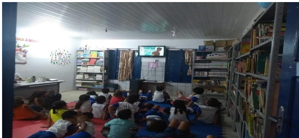
Figura 02- Crianças assistindo vídeo.

Entretanto, percebe-se conforme explicita Maranhe (2011, p. 40) “Sob esta concepção se institui no Brasil o Movimento de Arte/Educação que divulga entre nós a idéia da livre-expressão, tantas vezes distorcida e mal compreendida.” É, por exemplo, o que se observa nas experiências com arte, principalmente na Educação infantil, experiências muitas vezes descontextualizadas para as crianças, por se trabalhar de forma separada e distante da realidade das crianças.