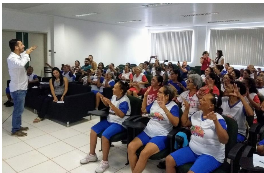
O coordenador do Projeto Tecituras realizando uma dinâmica com o “Poeminha do Contra”