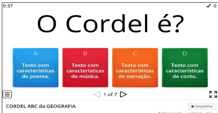
Figura 01 - Jogos digitais utilizados pelos alunos