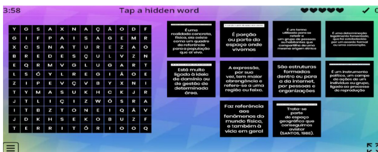
Figura 03: Jogos digitais utilizados pelos alunos. (cartões aleatórios)