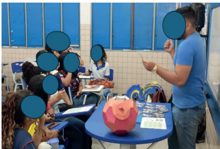
Figura 4. Aplicação do jogo em sala.

Foi observado durante a aplicação do jogo (figura 4) que os saberes que pareciam estar esquecidos foram sendo lembrados pelos próprios alunos e, dessa forma, puderam perceber que por meio da ludicidade, eles tinham aprendido de maneira positiva os conteúdos referentes a hidrocarbonetos. A atividade lúdica aplicada foi de muita valia pois além de ter sido a primeira atividade lúdica realizada com a turma, também proporcionou um momento de descontração, colaboração e trabalho em equipe entre os alunos.