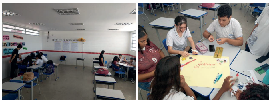
Figura 4 – Prática em sala de aula

tornar-se um professor profissional é, acima de tudo, aprender a refletir sobre sua prática, não somente a posteriori, mas no momento mesmo da ação. E a observação permite ao observador refletir sobre sua prática ainda no planejamento.