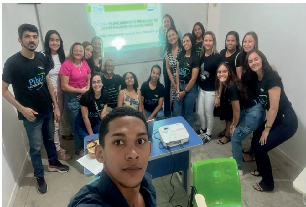
Figura 5 – Oficina de planejamento de audiolivro no IFPB

Outra atividade desenvolvida no PIBID/LETRAS do IFPB que merece destaque, foi a produção de audiolivro. Essa atividade é importante porque mostra aos bolsistas que a produção de materiais pedagógicos é também função do professor. E mais, que o professor, de posse de ferramentas digitais, pode produzir materiais interativos e inclusivos. Nesse sentido, a produção do audiolivro teve início com oficinas de formação com os professores do curso de Letras do IFPB, como visto na figura 5.