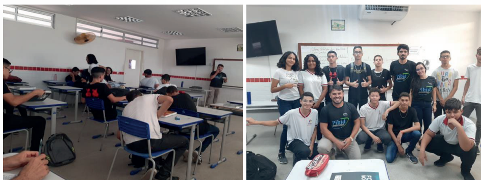
Figura 03 – Observação de aula

Tais questões os situam na realidade da educação básica. E refletimos a respeito dessas dificuldades, visto que eles podem enfrentar problemas parecidos. Segundo Gauthier (2001), a docência precisa ser vista numa perspectiva mais prática já que os professores em suas capacidades de agir, falar e de pensar – dotados de racionalidade – encontram formas para orientar a sua prática. Assim, o contato dos bolsistas com problemas do ambiente escolar permite que se criem uma forma de ver e de agir diante de questões similares, na busca de soluções.