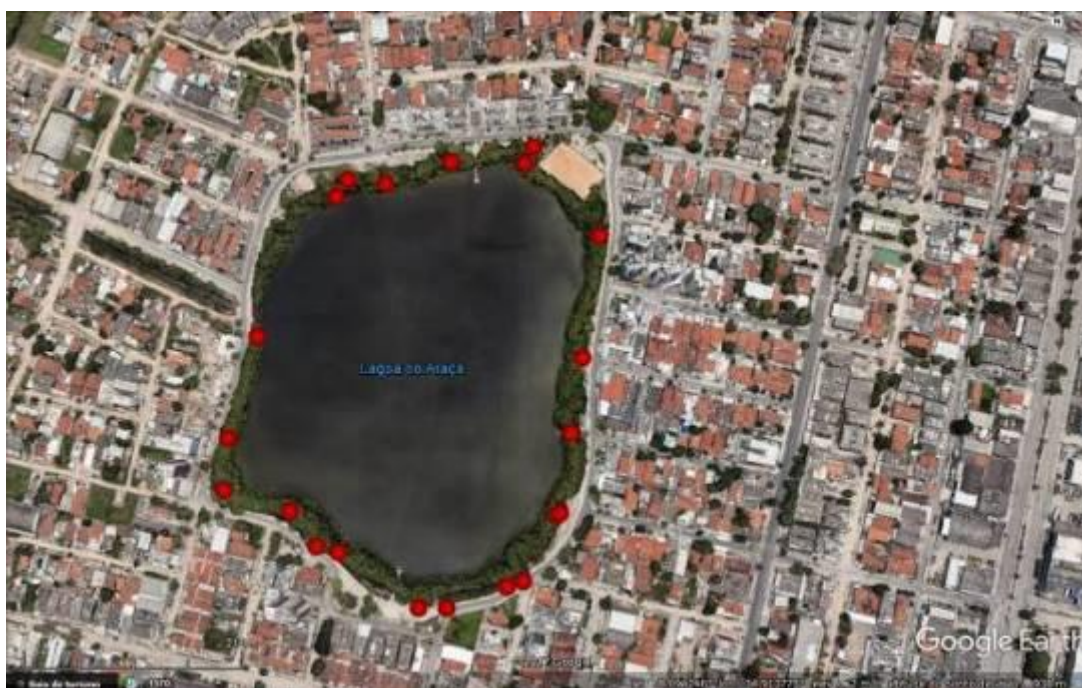
Figura 7. Pontos onde há canais que liberam efluentes na Lagoa do Araçá

Até mesmo as imobiliárias que fabricam o lugar, não se preocupam em manter o equilíbrio ambiental, infraestrutural da paisagem que estão valorizando, no início da urbanização os moradores relatam problemas de sobrecarga na rede elétrica local, ainda há reclamações quanto a sobrecarga da rede de coleta de esgotos, além disso, há canais direcionados a lagoa (Fig. 6) que liberam efluentes domésticos no corpo d'água.