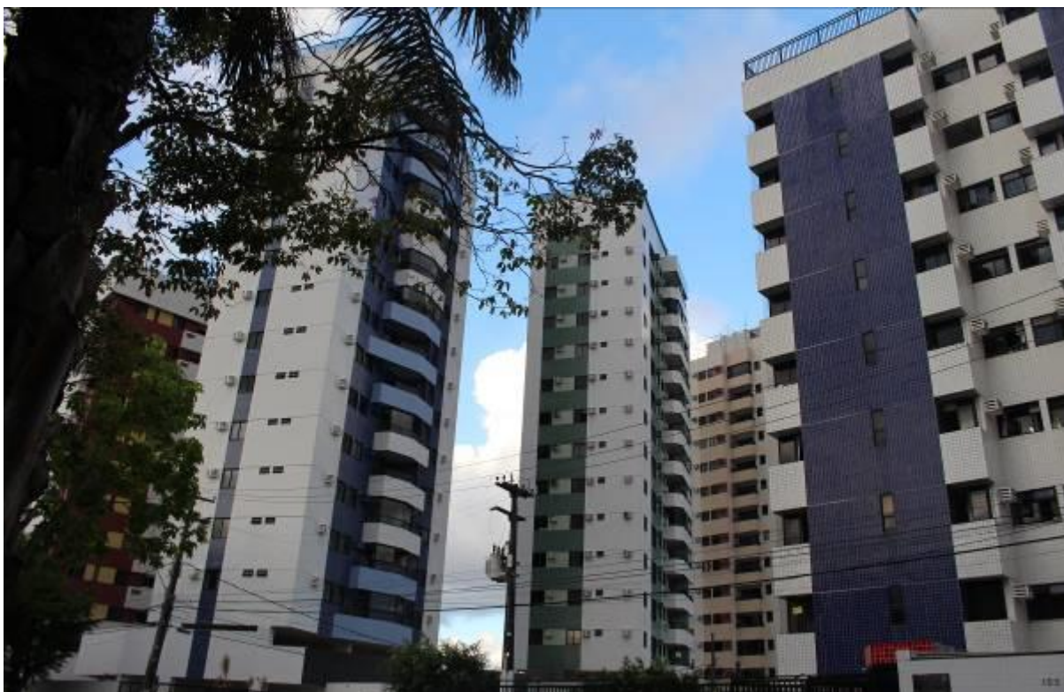
Figura 4. Lotes 27 e 28, edifícios de padrão socioeconômico elevado.