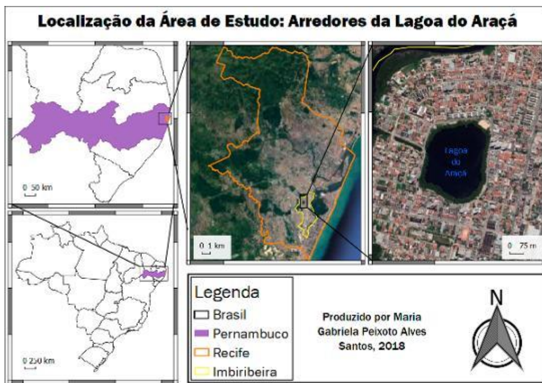
Figura 1. Localização da Lagoa do Araçá.

O presente estudo será realizado na Lagoa do Araçá, localizada na cidade de Recife – PE, no bairro da Imbiribeira (Fig. 1). De forma a alcançar os objetivos do presente trabalho inicialmente foi realizada pesquisa bibliográfica relacionada ao conceito de lugar, fabricação e construção do lugar, paisagem e ambiente. Além disso, a pesquisa bibliográfica foi realizada para compreender o histórico da Lagoa do Araçá. Esta revisão bibliográfica foi realizada a partir de livros, artigos, dissertações, leis, dentre outros. O acervo de documentos da Associação dos Amigos da Lagoa do Araçá (AALA) também foi consultado, com devida autorização da fundadora da associação.