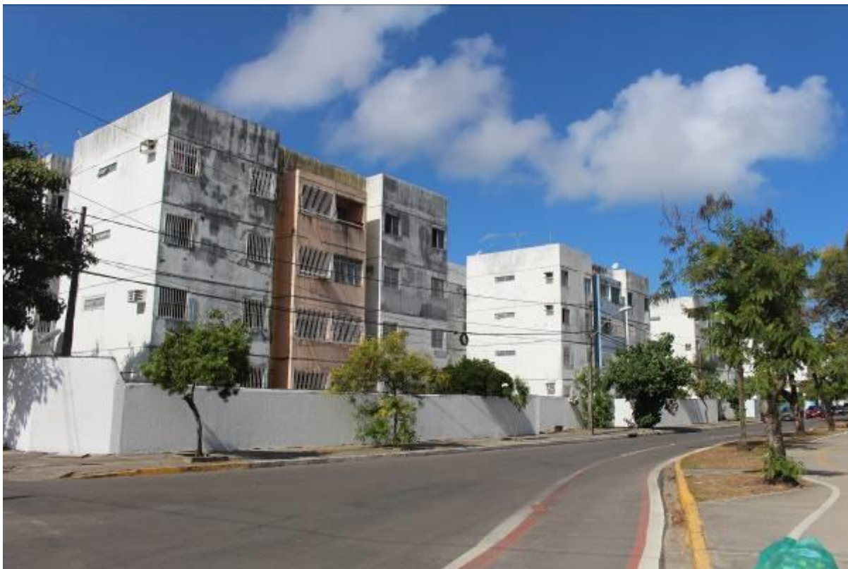
Figura 3. Lote 1, conjunto de edifícios de padrão socioeconômico mais baixo.