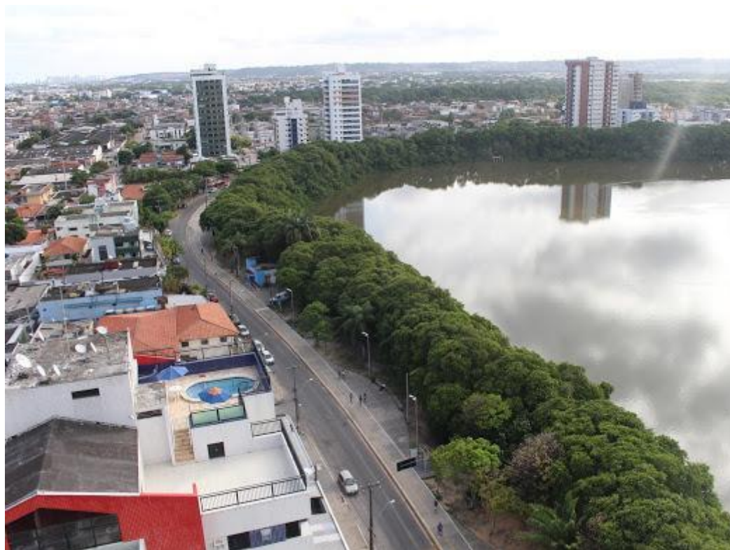
Figura 6. Valorização da paisagem para fabricação do lugar.