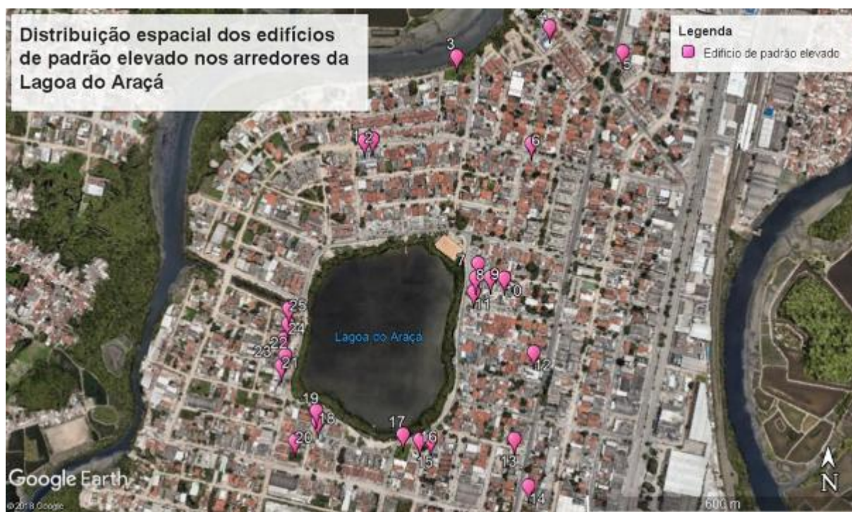
Figura 5. Distribuição espacial dos edifícios de padrão elevado nos arredores da Lagoa do Araçá.

Logo, a transformação da Lagoa do Araçá em Unidade de Conservação, além da urbanização de seus arredores, tornou toda a região em que a lagoa está inserida em uma área agradável e valorizada, o que provocou o surgimento de diversos empreendimentos destinados a um perfil socioeconômico mais elevado em comparação ao que residia até então (RAMOS, 2018). Este processo que segue em andamento, é principalmente representado pelos edifícios residenciais semelhantes aos de bairros ricos da cidade, a localização destes nos arredores da Lagoa do Araçá pode ser visto na Fig. 5.