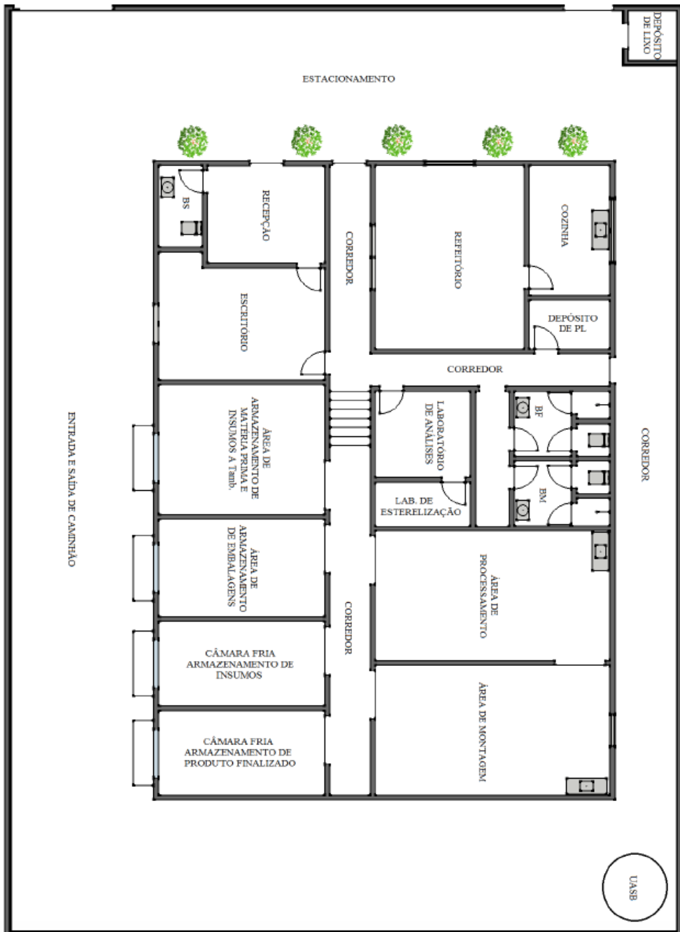
Figura 1: Layout da Área Construída.