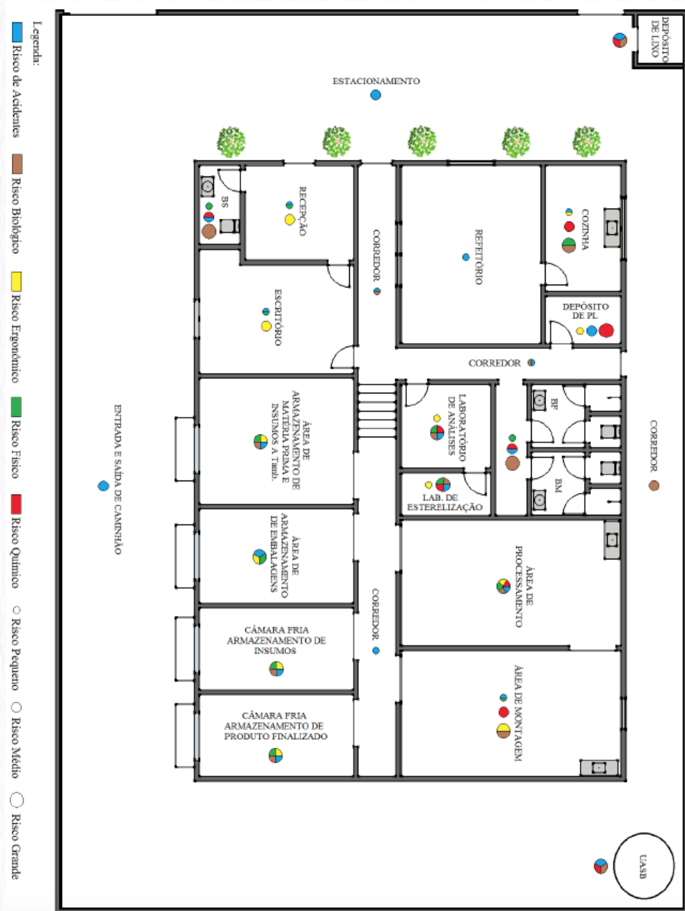
Figura 3: Mapa de Risco.

Para a segurança geral na indústria, haverá extintores com classes de incêndio A, B e C (Figura 4), obedecendo a NR23.