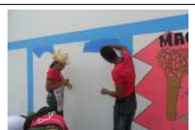
Literatura no muro/2011

Na figura 3 apresenta um anúncio criativo, tendo como finalidade divulgar o romance lido.