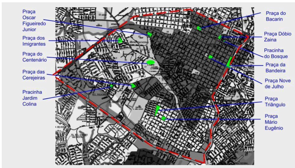
Figura 1: Indicação do Perímetro e Localização das Doze Praças Analisadas