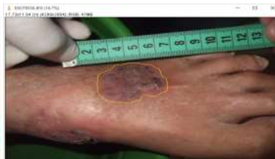
Figura 2: Úlcera varicosa no dorso do pé.

Após admissão do paciente, o mesmo foi submetido a uma avaliação clínica (dados pessoais, característica da lesão, tratamentos prévios e doenças associadas) realizada pelos autores da pesquisa.