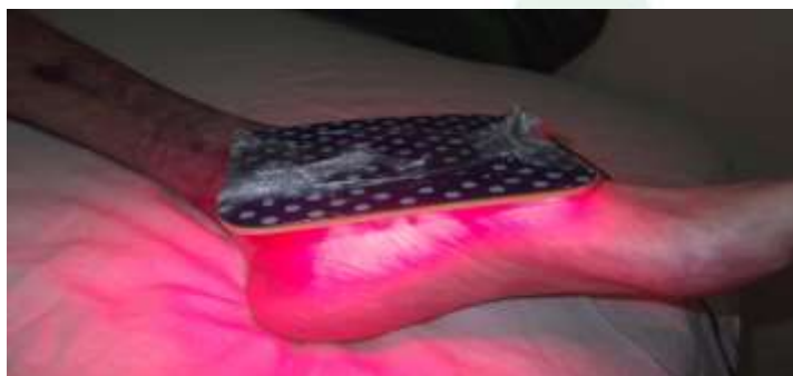
Figura 3: Uso do LED.

O aparelho de fototerapia utilizado foi o Linealux Rosso, placas flexíveis de 10x13 cm contendo 36 LED's vermelhos de 660 nm, sem emissão de UVB, garantindo a segurança do usuário. O uso do LED não causa aumento de temperatura e nenhum tipo de dano celular (Figura 3).