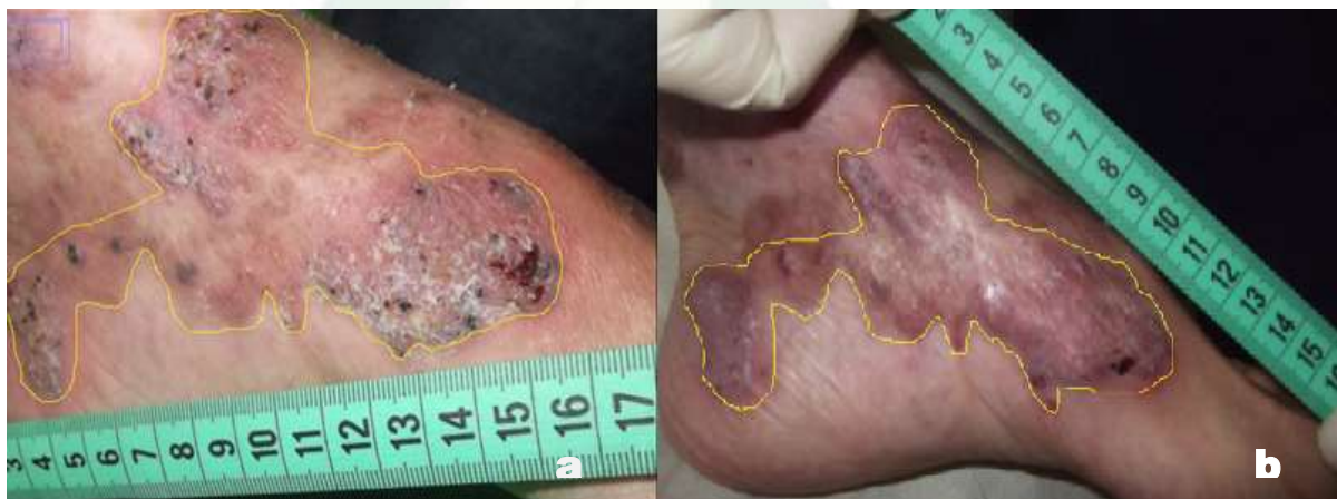
Figura 6: Imagem representa a região terço distal e medial do pé; a- antes da intervenção com LED; b- após a intervenção do LED.

Com relação a área das lesões na figura 5a encontramos 25 múltiplas lesões somando uma área total de 0,556\text{cm}^2 antes do LED, na figura 5b encontramos 14 múltiplas lesões somando uma área total de 0,054\text{cm}^2 após intervenção. Ao subtrairmos o antes e o depois teremos um valor de 0,502\text{cm}^2 contabilizando o ganho do fator cicatricial. Na figura 6a encontramos 36 múltiplas lesões somando uma área total de 1,289\text{cm}^2 antes do LED, na figura 6b encontramos 15 múltiplas lesões somando uma área total de 0,487\text{cm}^2 após intervenção. Ao