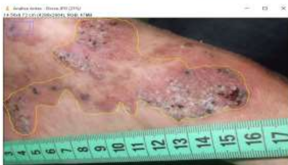
Figura 1: Úlcera varicosa no terço distal e região medial do pé.