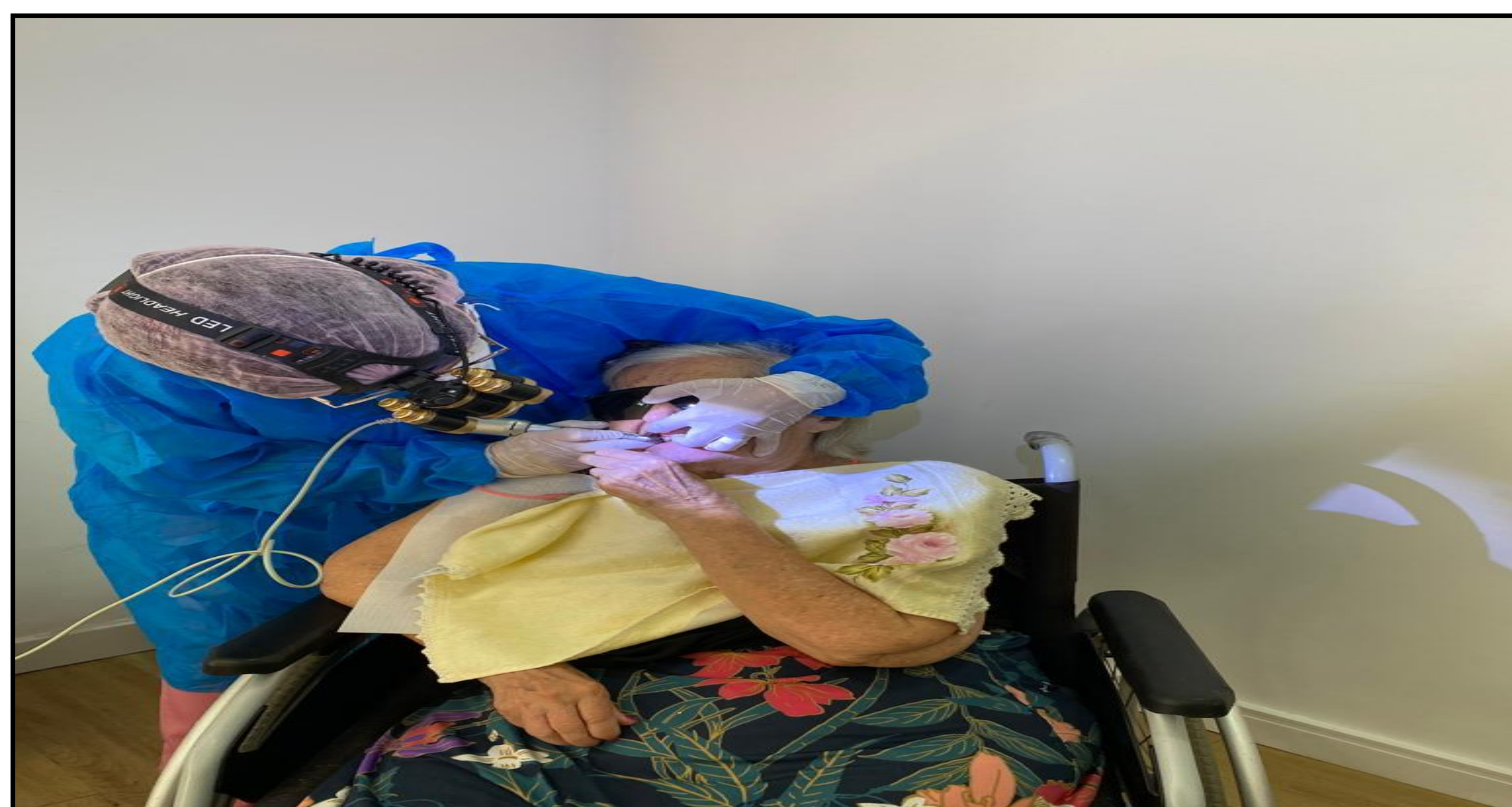
Fig. 1– Paciente sendo atendida na cadeira de rodas