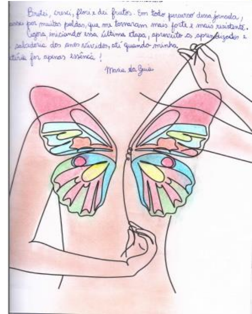
Figuras: Arquivo próprio, 2022.