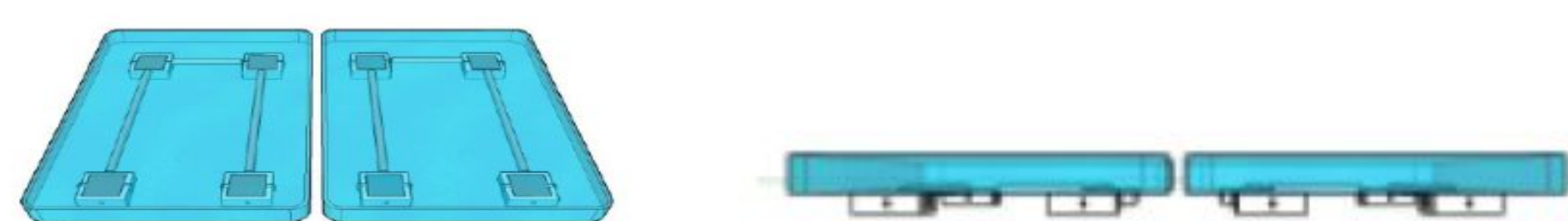
Figura 02: imagem ilustrativa da base mecânica em 3D e na vista frontal, e seus quatro sensores.