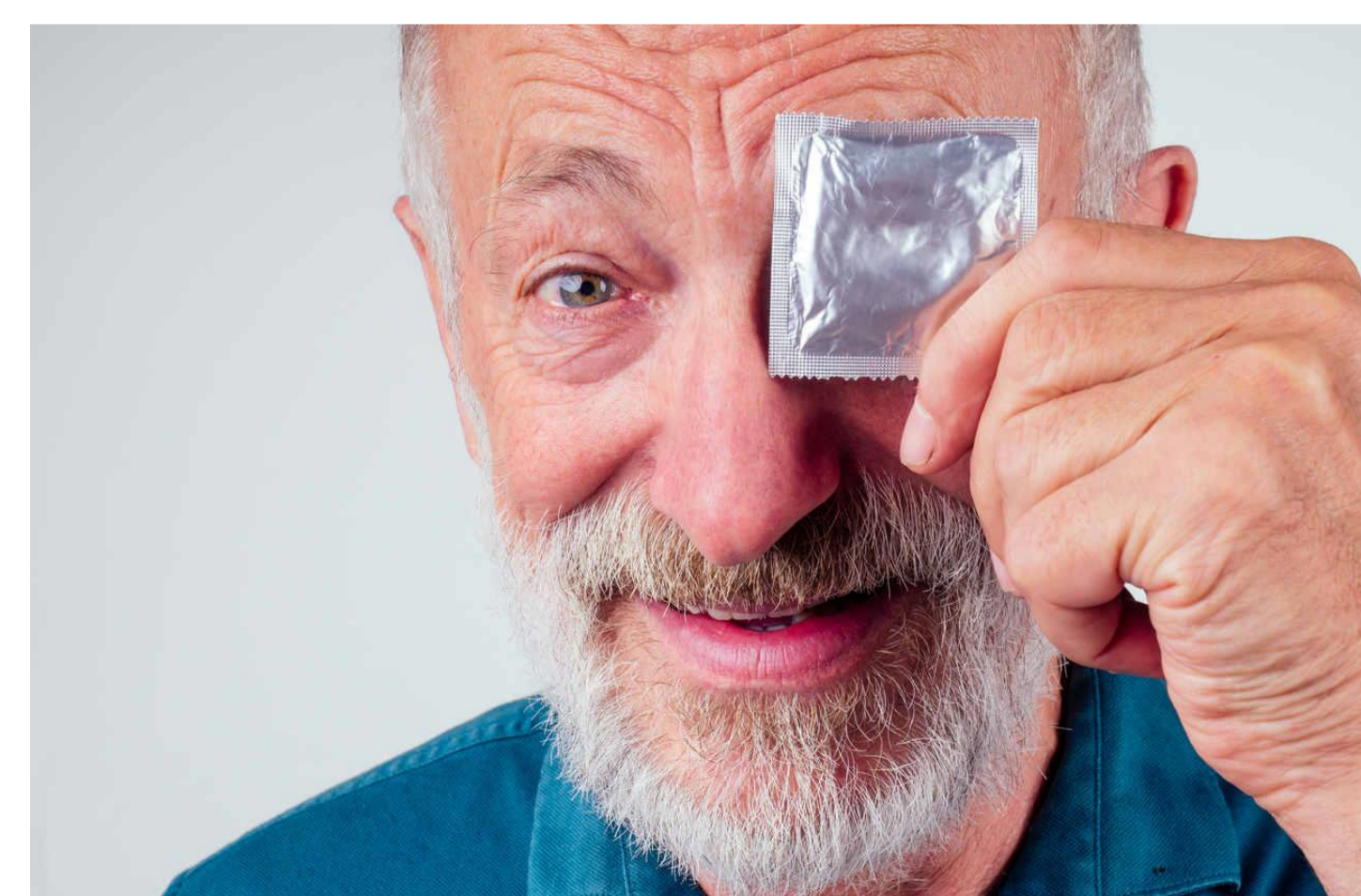
Casos de HIV em idosos quadruplicaram no Brasil na última década Em números absolutos, os testes positivos para esse vírus pularam de 360 em 2011 para 1,5 mil em 2021 nos mais velhos

Percebeu-se que mesmo sendo discutido, explicado e clarificado, o método cirúrgico de contracepção não serve como método protetivo, ainda assim, para os idosos o principal objetivo é ter relação sexual sem preservativo evitando gravidez. O aumento do número de divórcio contribuiu e a longevidade atual somado ao relacionamento extraconjugal, uso de medicação e atividade sexual também acrescenta a busca pela vasectomia.