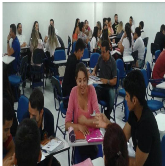
Figura 3b. Brainstorming .

Em todas as atividades o professor torna-se mediador, e avalia o aluno, possibilitando a geração de novas ideias e soluções para ensinar e aprender na formação profissional, focando no trabalho em equipe, dinamicidade, construção e reconstrução dos planos pedagógicos tradicionais.