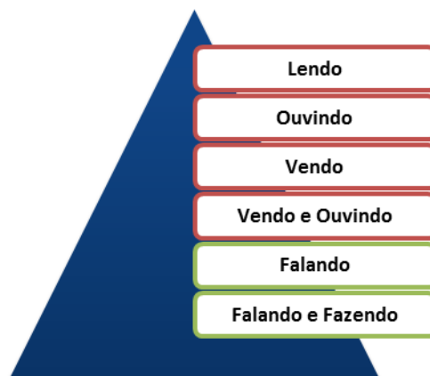
Figura 1. Princípios da Aprendizagem Efetiva.

Em síntese, destaca-se que a efetividade da aprendizagem requer do aluno habilidades de ler, ouvir, ver, falar e fazer, todavia, à medida que o aluno desempenha apenas as quatro primeiras competências citadas (lendo, ouvindo, vendo e vendo e ouvindo) diz-se que este está imerso em um processo de aprendizagem passiva. Entretanto, à medida que é exigida do discente a resolução de atividades dinâmicas, que o incite a compartilhar seu conhecimento (falando e falando-fazendo), diz-se que a aprendizagem é ativa e promove melhorias significativas ao aprendizado efetivo dentro e fora do ambiente escolar.