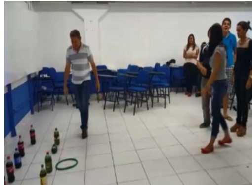
Figura 2b. Competições e Gincanas Acadêmicas.

As figuras 3a e 3b ilustram respectivamente situações de negociações práticas entre grupos e brainstorming para que os alunos discutam suas ideias de forma criativa para a finalização da aula.