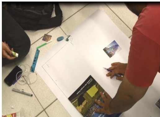
Figura 2a. Dinâmicas de Grupo.