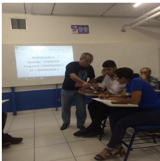
Figura 3a. Negociações Práticas entre grupos.

As figuras 3a e 3b ilustram respectivamente situações de negociações práticas entre grupos e brainstorming para que os alunos discutam suas ideias de forma criativa para a finalização da aula.