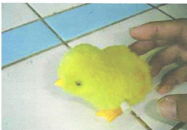
Figura 2 – Pintinho de corda