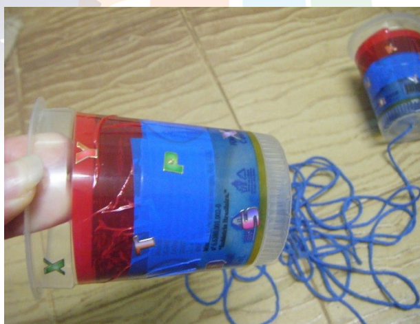
Figura 4 – Telefone sem fio