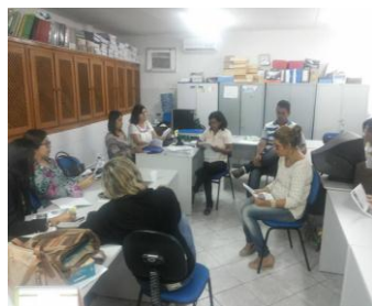
1ª Sessão de Estudo