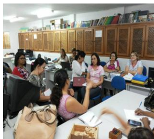
5ª Sessão de Estudo