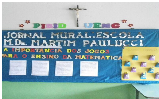
Figura 06: Jornal mural 3