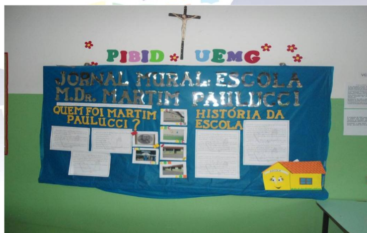
Figura 2: Jornal mural 1

Posteriormente, quando toda escola já havia se habituado ao mural, implementamos o jornal mural, onde as crianças atendidas pelo PIBID escolhiam a temática a ser postada e também elaboravam as notícias em conjunto com os bolsistas. As figuras de 2 a 9 exemplificam os jornais murais.