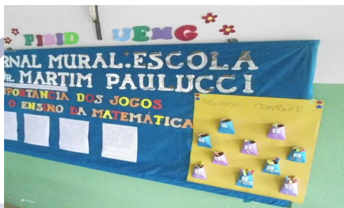
Figura 07: Detalhes do jornal mural 3