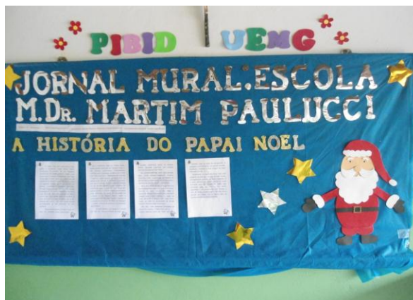
Figura 09: Detalhes do jornal mural 4

Foram feitas reportagens sobre a pessoa que dá nome à escola (Dr. Martim Paulucci); sobre uma senhora muito conhecida na comunidade em que a escola se encontra para sabermos a história do bairro; sobre a importância dos jogos para a aprendizagem da matemática; e sobre a história do Papai Noel. Vale ressaltar que os temas foram escolhidos pelos próprios alunos atendidos pelo PIBID, que também auxiliaram em sua confecção.