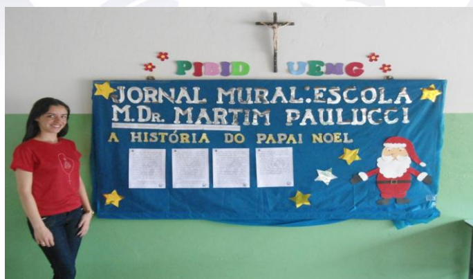
Figura 08: Jornal mural 4