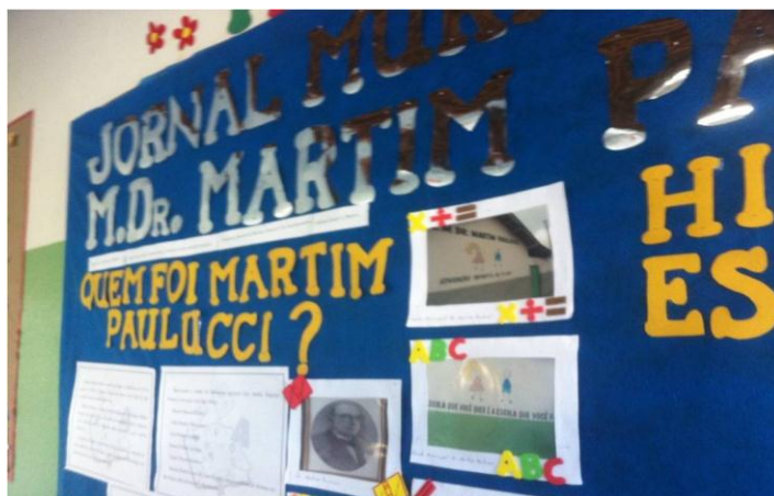
Figura 3: Detalhes do jornal mural 1