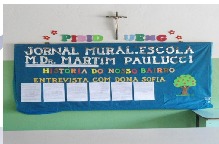
Figura 4: Jornal mural 2