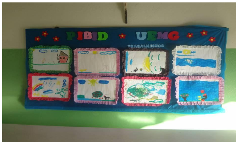
Figura 1: Mural

Posteriormente, quando toda escola já havia se habituado ao mural, implementamos o jornal mural, onde as crianças atendidas pelo PIBID escolhiam a temática a ser postada e também elaboravam as notícias em conjunto com os bolsistas. As figuras de 2 a 9 exemplificam os jornais murais.