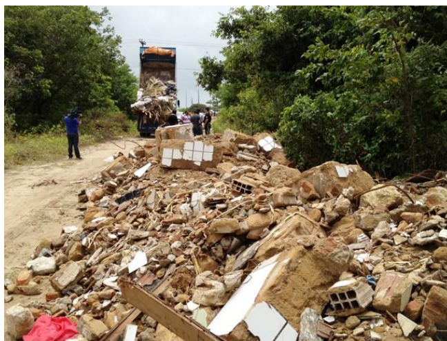
Figura 5: Resíduos de entulho no geral

Na figura 5, foi possível identificar uma área que recebe de forma inadequada os resíduos da construção civil como destino final, devido estar localizadas em áreas mais ociosas e mais afastadas da circulação da maioria da população.