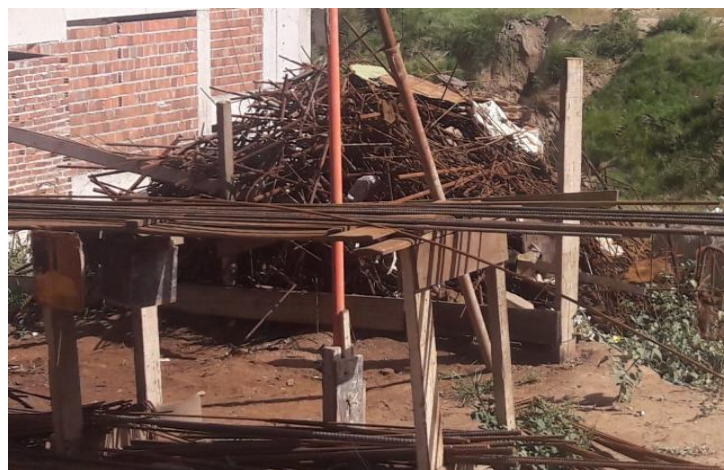
Figura 3: resíduos de ferros velho.

Pode-se observar na figura 3, que na obra visitada, os resíduos de ferro são armazenados em determinados locais dentro do canteiro de obra, permanecendo até que seja transportado para um ferro velho, onde deverá ser reutilizado ou reciclado. Percebe-se que a conservação inadequada ou sem os devidos cuidados desses resíduos, por um longo período de tempo, ocasionou o surgimento de mato, atraindo assim, diversos tipos de roedores e insetos e, conseqüentemente, pode trazer diversos tipos de doenças para as pessoas que ali circulam. O acúmulo também pode causar acidentes, dentro da obra.