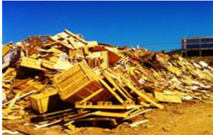
Figura 2: resíduos de madeira.