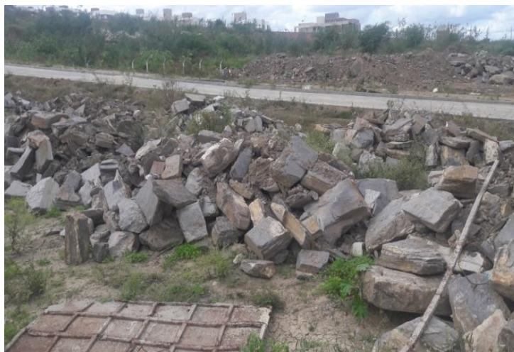
Figura 4: resíduos de pedras.

surgimento de vários animais, podendo assim, ocasionar o surgimento de doenças.