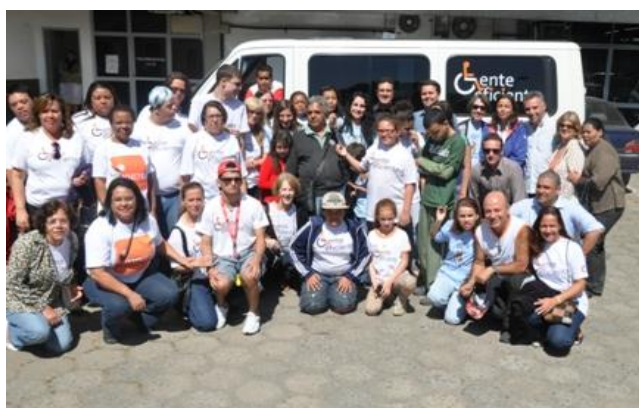
Figura 5 – Aquisição de Van

O serviço desenvolvido por essa equipe que demonstra empenho, profissionalismo, garra, amor, o Gente Eficiente conseguiu através de decreto municipal em 2016, fazer parte do quadro dos programas educacionais existentes dentro da secretaria municipal de educação garantindo assim, a sua efetividade dentro das políticas públicas municipais, o que foi um grande ganho para seus usuários e para a população.