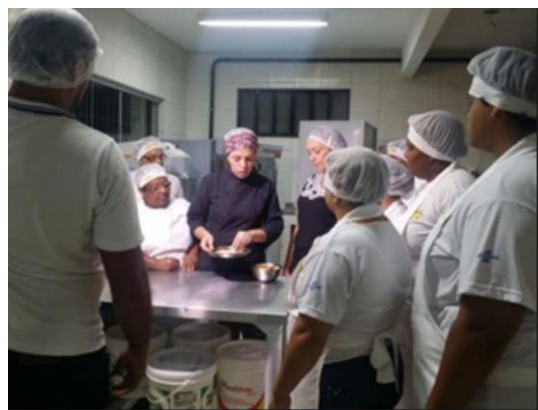
Figura 3 – Aula de panificação

Ainda no ano de 2015 um projeto do programa ficou em segundo lugar no Volkswagen Comunidade, e a coordenadora, realizadora do projeto ganhou um curso em São Paulo. A Igreja Batista local proporcionou através do projeto “Repartir o Pão” que 4 alunos fizessem o curso de panificação.