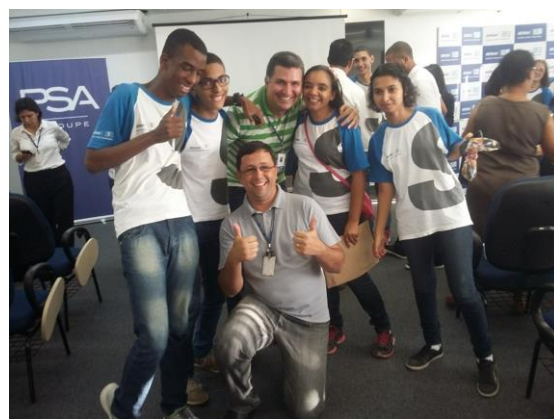
Figura 2 – Curso SENAI

São exemplos de algumas destas parcerias estabelecidas: a empresa UNIMED Resende que incentivou a contratação de uma Van para transportar os alunos, isso ocorreu no biênio 2013 / 2014. Outra foi com a Votorantim Siderurgia nos anos 2011/2012 capacitando um total de 120 pessoas com deficiência nas áreas de Informática e Assistente Administrativo.