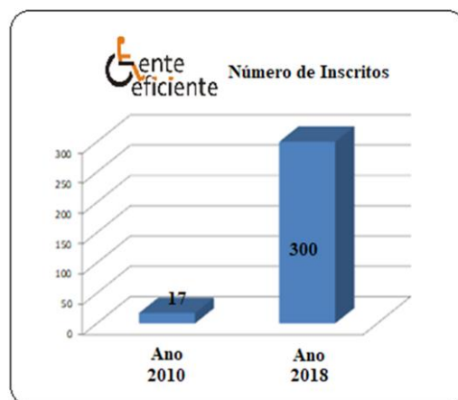
Gráfico 1 – Nº de Inscritos de 2010 a 2018

Em outro momento com o Governo Federal que enviou material didático pedagógico e esportivo para enriquecerem as oficinas além de uniformes e bonés. A Empresa de ônibus São Miguel cedeu os primeiros uniformes. A Peugeot Citroen em convênio com o SENAI capacitou pessoas com deficiência na área de Assistente Administrativo e Mecânica. Em 2015 foram 10 alunos no Curso de Assistente Administrativo e 3 no de Mecânica, em 2016, 10 cursaram Administração e 2 Mecânica.