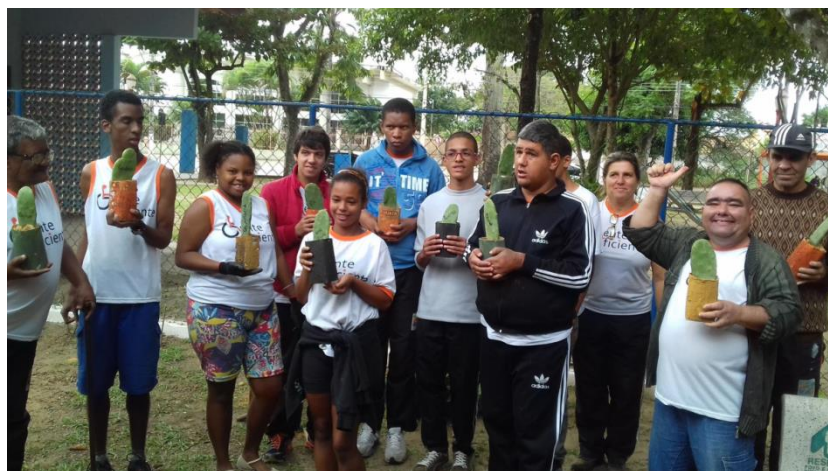
Figura 6 – Aula de Educação Ambiental

Concluindo , a Prefeitura de Resende implantou este programa visando inserir a pessoa com deficiência no contexto social, educacional, sócio cultural e esportivo para melhor atender os participantes dando-lhes dignidade e respeito sendo, portanto um grande desafio. Desde Maio de 2010, onde existiam apenas 17 pessoas cadastradas, com a criação do Programa, passou para cerca de 300 participantes, com atividades dirigidas. Acredita-se que estes atendimentos podem ser potencializados contemplando um número maior de beneficiados. Certamente é no trabalho de base que se demonstra a necessidade de se criar ações onde eles possam ser assistidos com os recursos públicos e parcerias firmadas. Os deficientes têm condições de conviver com os demais, tendo suas potencialidades fortalecidas e exploradas deixando suas limitações para segundo plano. Portanto, os preconceitos devem ser derrubados, primeiramente pela sociedade e famílias. Cabe a cada um de nós fazermos a nossa parte para permitir uma sociedade mais inclusiva.