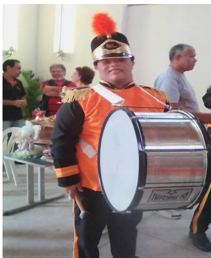
Figura 4 - Uniforme da Fanfarra

Fonte: Igreja Batista Central de Resende - 2018