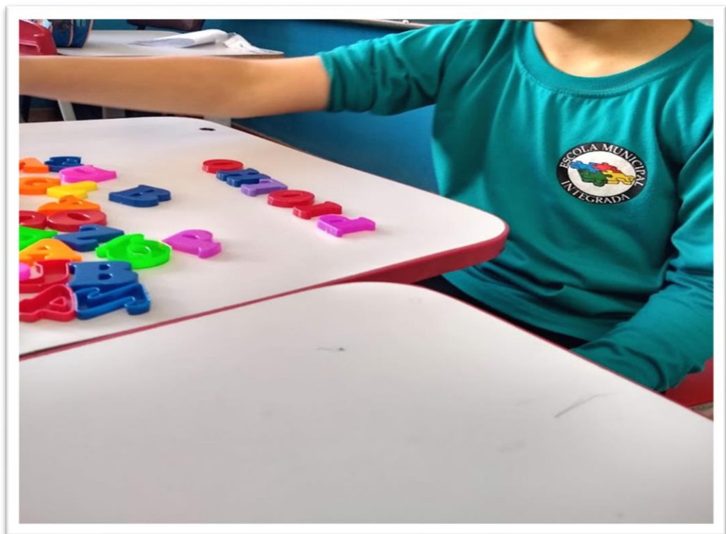
Figura 2. Dificuldades de escrita com o alfabeto móvel.

As atividades permanentes desempenharam um papel fundamental no desenvolvimento consistente das habilidades de leitura e escrita das crianças, especialmente no início do segundo ano de escola, quando suas habilidades de alfabetização não estavam consolidadas. Essas atividades, apoiadas pela abordagem sociointeracionista, promoveram a autoconfiança das crianças, permitindo que elas avançassem em tarefas mais complexas, com interações em grupos e duplas que as deixaram mais seguras.