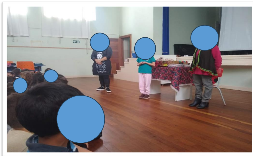
Figura 3. Oficina de Contação de história.