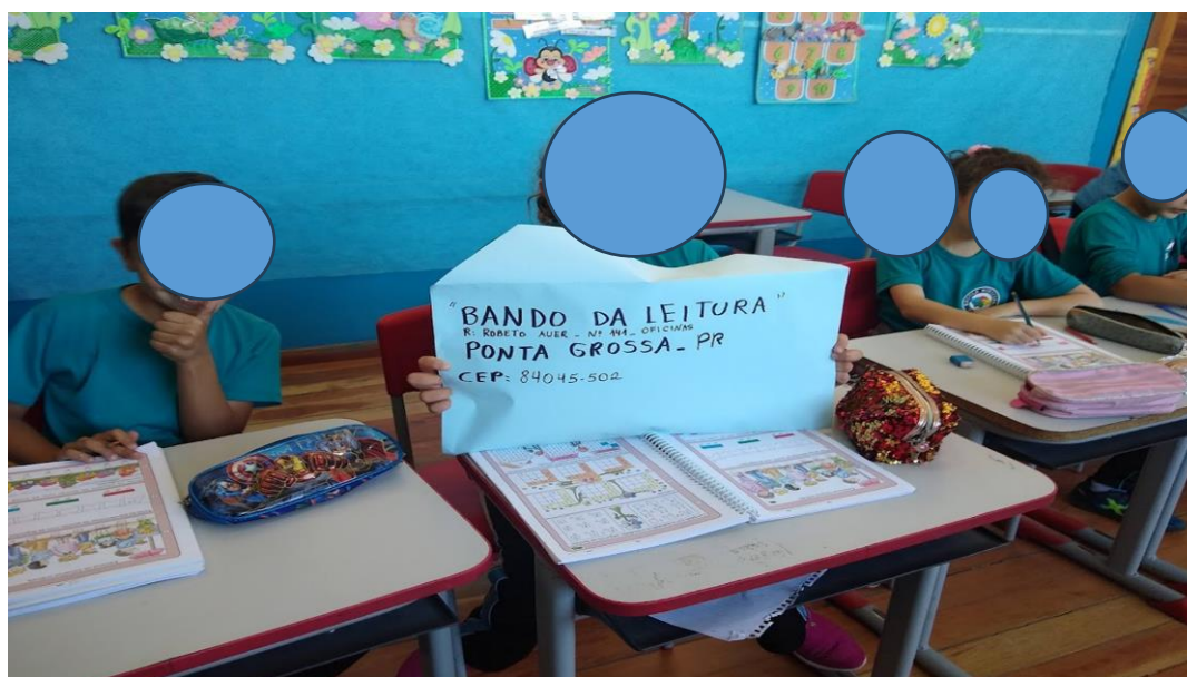
Figura 4. Construção em grupo de uma carta.

A variedade de gêneros textuais e a inclusão de métodos diversos, como jogos, música, tecnologia e prática, mantiveram os alunos engajados e motivados, tornando as atividades permanentes atrativas e eficazes, resultando em uma aprendizagem envolvente e significativa.