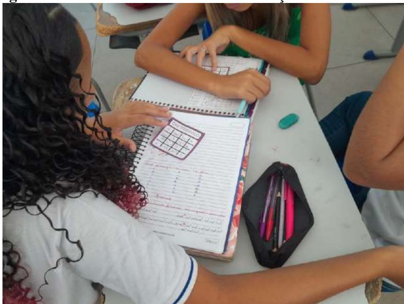
Imagem – 1: Estudantes realizando a distribuição do DISTRIBINGO.

A execução da atividade lúdica foi dividida em três momentos: no primeiro houve a introdução do assunto de configuração eletrônica pela professora e supervisora da escola; no segundo momento houve uma sequência do assunto e a realização de atividades de fixação ao final; no terceiro e último momento, foi realizado jogo didático do DISTRIBINGO, conforme a imagem 1.