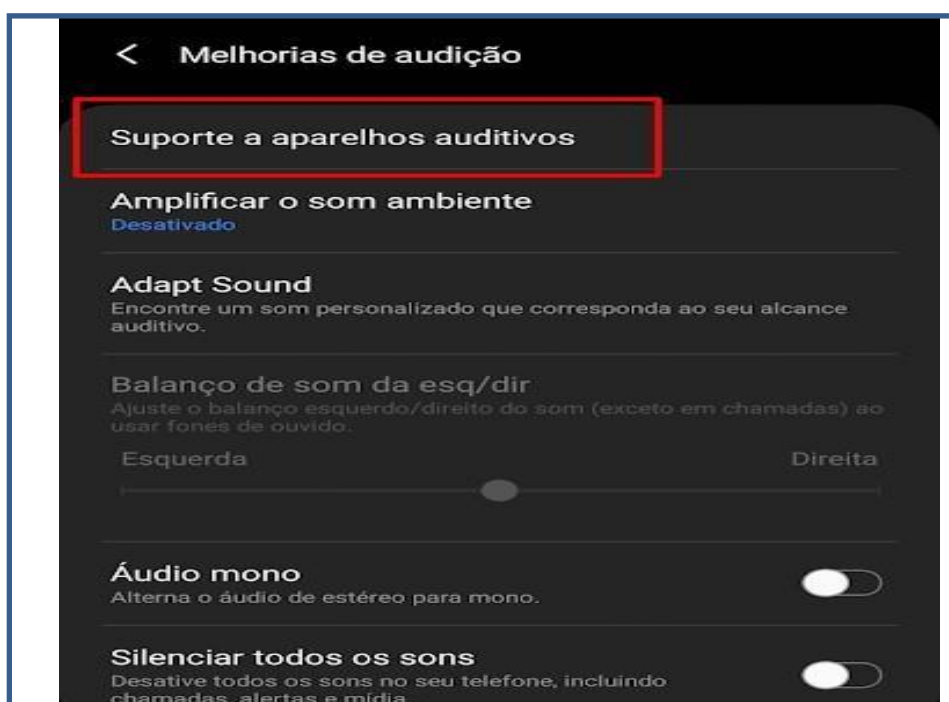
Figura 14- Quadro de explicação sobre suporte para aparelhos auditivos

Outro recurso a ser citado por Magalhães (2020) deve-se ao “Suporte para aparelhos auditivos” nele aparelhos auditivos com conexão bluetooth podem ser pareados em aparelhos com Android 10 ou posterior. Para isso, basta seguir o mesmo caminho para conexão de qualquer outro dispositivo nas configurações do Bluetooth. Com essa conectividade via bluetooth, é possível conectar o áudio vindo de uma chamada diretamente com o aparelho auditivo, o aparelho ainda possibilita controlar o volume e a direção do som, com até cinco metros de distância do telefone celular.