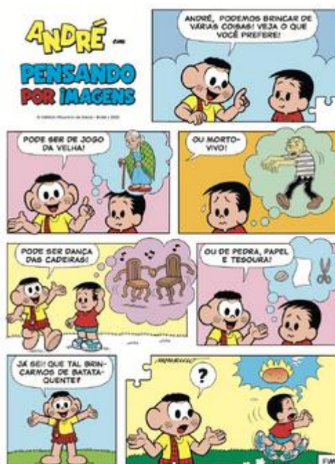
Imagem 2 – HQ de André e Cascão