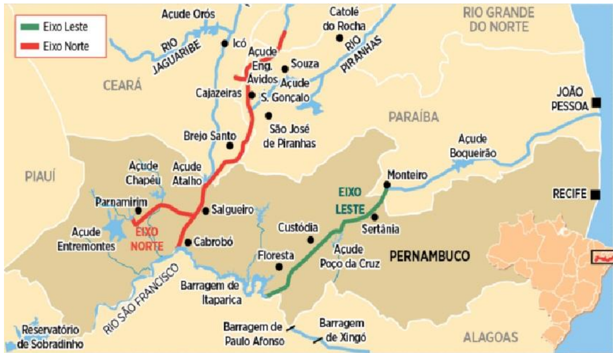
FIGURA 1 – Eixos de integração das águas do São Francisco

no Pernambuco, na bacia do São Francisco (GONÇALVES, 2014). O Projeto de Integração do Rio São Francisco com as bacias hidrográficas do Nordeste setentrional está dividido em dois principais eixos (Eixo Norte e Eixo Leste), conforme demonstrado na figura a seguir.