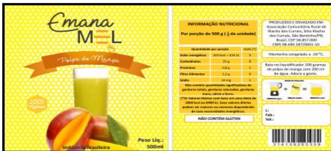
Figura 2 – Rótulo de polpa de manga, porção de 500 g.