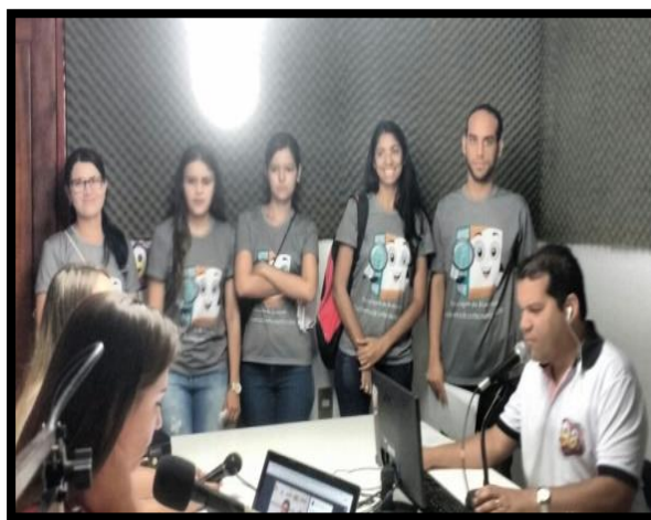
Figura 4 - Participação da equipe do projeto na rádio Maringá FM, em Pombal – PB.

A participação na rádio Maringá FM da cidade de Pombal – PB ocorreu por meio do contato da equipe do projeto com os administradores, para a difusão do conhecimento proposto atingindo mais de perto e com maior abrangência a população local sobre o tema em discussão (Figura 4).