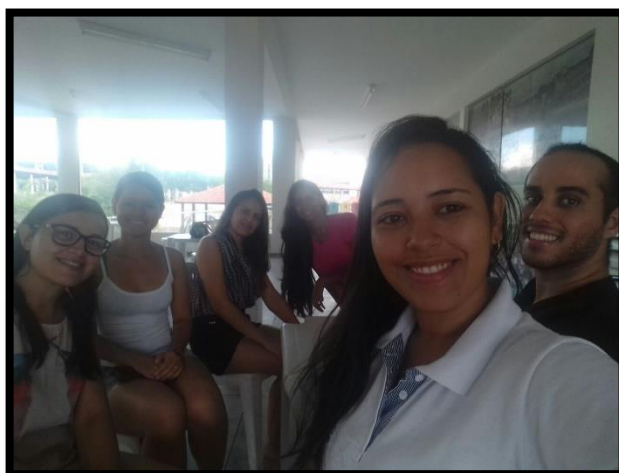
Figura 1 – Equipe do projeto em um encontro.

Foram realizadas reuniões de planejamento e avaliação entre os membros da equipe do projeto para detalhamento e distribuição das atividades, além do estudo e discussões sobre as principais legislações referentes à rotulagem de alimentos no Brasil. A Figura 1 apresenta um dos encontros realizados pela equipe do projeto.