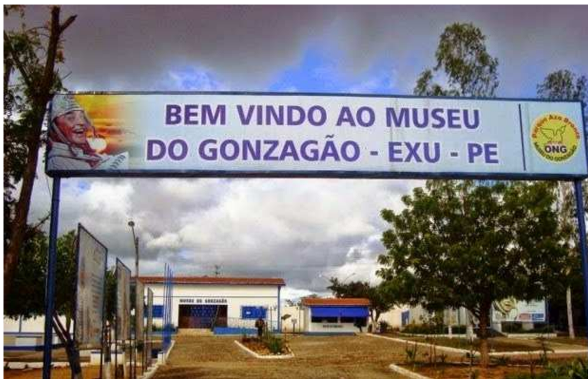
Figura 2. Museu do Gonzagão em Exu-PE.

O Museu Gonzagão (figura 2), situado no Parque Asa Branca - na cidade de Exu-PE, é um espaço cultural dedicado a preservar a memória do Rei do Baião – Luiz Gonzaga (1912-1989). Ele foi idealizado pelo próprio artista – que, já com a carreira consolidada, quis construir um complexo de atrações para preservar seu nome e sua obra. No local é possível encontrar o maior acervo material original do músico. Entre os objetos pessoais, há sanfonas, chapéus, sandálias e gibão de couro, discos de ouro e fotografias. Sem verba pública, o museu é mantido com recursos particulares e, segundo guias e administradores, vive “uma eterna pendura”. O valor da entrada é R$ 8 para adultos e R$ 4 para crianças e idosos.