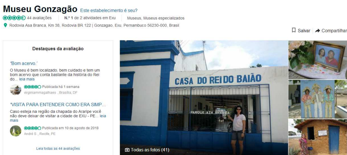
Figura 1. Página dos colaboradores sobre o Museu do Gonzagão no TripAdvisor.

Na figura 1 apresentamos a página de opiniões dos colaboradores sobre o Museu do Gonzagão no TripAdvisor, onde é possível identificar algumas imagens do atrativo e as avaliações realizadas até aquela data. Além de atribuir uma nota de 1 a 5 para o atrativo, sendo excelente (5), muito bom (4), razoável (3), ruim (2) e horrível (1), o avaliador pode escrever suas impressões, detalhando a avaliação, recomendando ou não o atrativo.