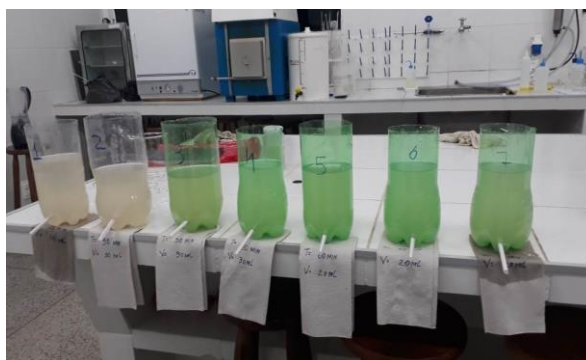
Figura 2 – Garrafas PET utilizadas no tratamento de 1 L de água de cisterna com Moringa oleifera.

Os testes foram conduzidos em garrafas PET, conforme apresentado na Figura 2, sendo utilizados como coagulante as sementes descascadas e trituradas em moinho de facas e uma solução preparada na proporção de 20 gramas (g) de sementes para 1 litro (L) de água destilada.