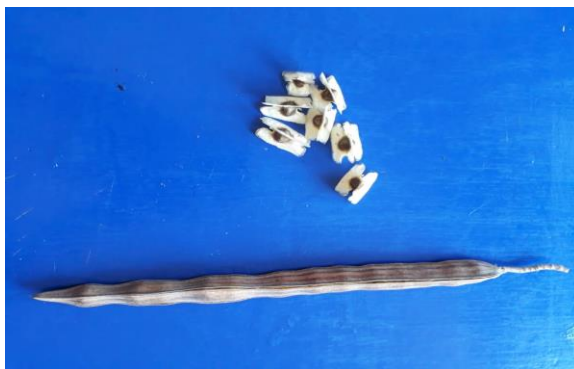
Figura 1 – Sementes da Moringa oleifera antes da moagem

As sementes utilizadas para o processo de clarificação foram coletadas nas dependências do Centro de Formação de Professores (CFP), da Universidade Federal de Campina Grande (UFCG), campus de Cajazeiras- PB, Figura 1. As sementes foram separadas das vagens (fruto) e em seguida após a remoção das suas cascas foram moídas em moinho de facas tipo Willey macro – Tn650/1 com peneira.