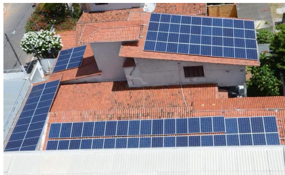
Figura 1 - Placas solares localizadas na microempresa.

Por meio da visita in loco, foram adquiridas diversas informações sobre o sistema utilizado pela empresa, que começou a operar em janeiro de 2017. O módulo fotovoltaico utilizado possui eficiência “A” (na qual a escala A-E segue no sentido menos eficiente para E) e uma Produção Média Mensal de Energia estimada de 33,12 kWh/mês por painel (foram instalados 106 painéis em uma área de 158,4 m 2 ), na qual kWh é a soma da energia total gerada em um dado período de tempo. A potência nas condições padrão era de 265 W.