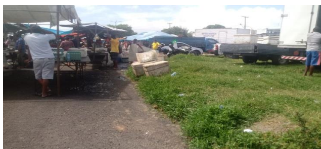
Figura 2: vista lateral da feira