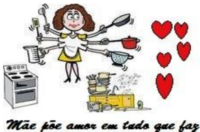
Imagem 2: Arte presente em um brinde dado às mães