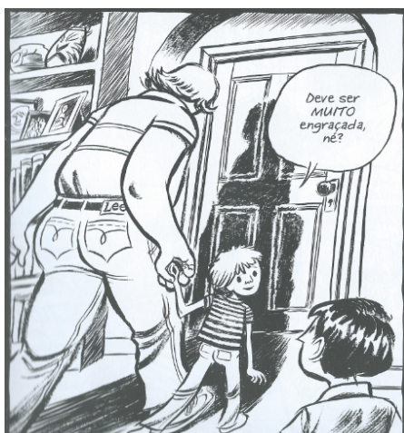
Fig.1, Retalhos , p. 31.

À mágoa, portanto, soma-se a incerteza do perdão divino. A figura abaixo permite observar os reflexos da culpa na memória de Craig, pela forma como retrata o irmão, que ele julga dever ter sido capaz de defender: pequeno e frágil, olhar inocente, traduzindo total confiança, enquanto segue levado pela mão do molestador. Há, ainda, uma tentativa de autojustificativa inconsciente da impotência: o narrador não deixa de mostrar que ele precedeu o irmão no quarto com o baby-sitter ; além do mais, em todos os quadrinhos em que o molestador aparece, ele é grande, forte, e o contraste entre ele e os meninos é visível: