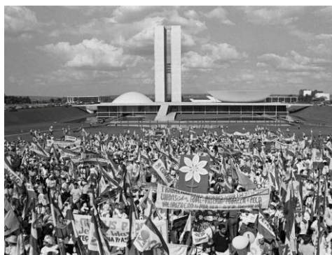
Figura nº 1– Primeira Marcha das Margaridas