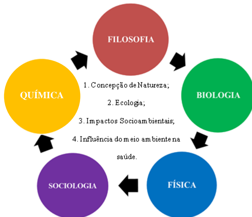
Diagrama 2: Inter-relação entre os componentes curriculares