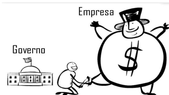
Figura 02. Governo / Empresa.

A ‘imagem’ marcante do documentário expressa uma íntima relação entre “Governo- Empresa”, nas quais serviu de variadas discussões sobre a análise crítica da mesma (Figura 02).