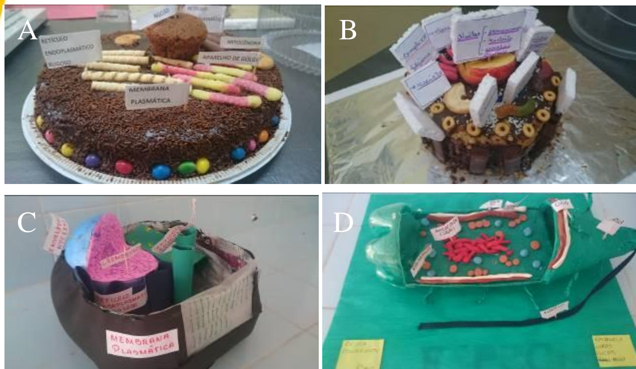
Figura 2. a. Modelo didático de célula eucariótica animal construído a partir de material comestível, b. Modelo didático de célula eucariótica vegetal construída a partir de material comestível, c. Modelo didático de célula eucariótica animal construído a partir de material reciclável, d. Modelo didático de célula procariótica a partir de material reciclável.

Os métodos de ensino tradicionais utilizam-se apenas de uma pequena fração da capacidade da aprendizagem (CASTOLDI et al, 2005), de forma que, quando observados os resultados nas respectivas avaliações cotidianas somos levados a concluir que a aula expositiva unicamente não é suficiente para suprir o processo de ensino aprendizagem. Apesar da era tecnológica a qual nos encontramos, a educação tende a limitar-se a aula expositivas de baixa frequência na participação dos alunos comprometendo assim o desenvolvimento cognitivo, uma das principais metas da educação (ESCOLANO et al, 2010).