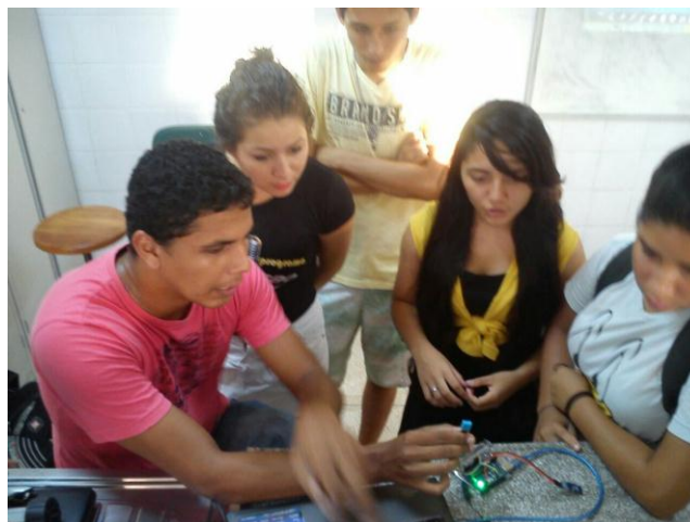
Figura 03: Professor apresentando o sensor aos alunos

A apresentação do experimento proporcionou aos alunos relacionar o conceito físico com seu cotidiano, pois durante a execução da atividade, percebeu-se que a aceitação dos alunos foi o fator importante, pois quando os mesmos conseguiram realizar as mudanças nas diferentes escalas com os valores obtidos pelo sensor, pois muitos não gostavam do assunto, achando que o mesmo não tinha importância e não se fazia presente no seu dia a dia (figura 03).