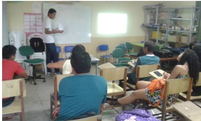
Figura 02: aulas com os alunos.

A apresentação do experimento proporcionou aos alunos relacionar o conceito físico com seu cotidiano, pois durante a execução da atividade, percebeu-se que a aceitação dos alunos foi o fator importante, pois quando os mesmos conseguiram realizar as mudanças nas diferentes escalas com os valores obtidos pelo sensor, pois muitos não gostavam do assunto, achando que o mesmo não tinha importância e não se fazia presente no seu dia a dia (figura 03).