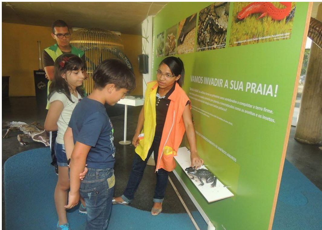
Figura 5: Atuação do monitor no painel de Revolução dos bichos – Pavilhão de exposições.