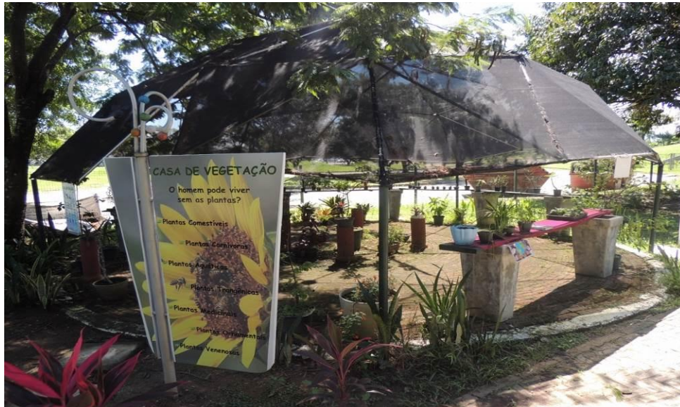
Figura 3: Casa de vegetação – presente na trilha ecológica.