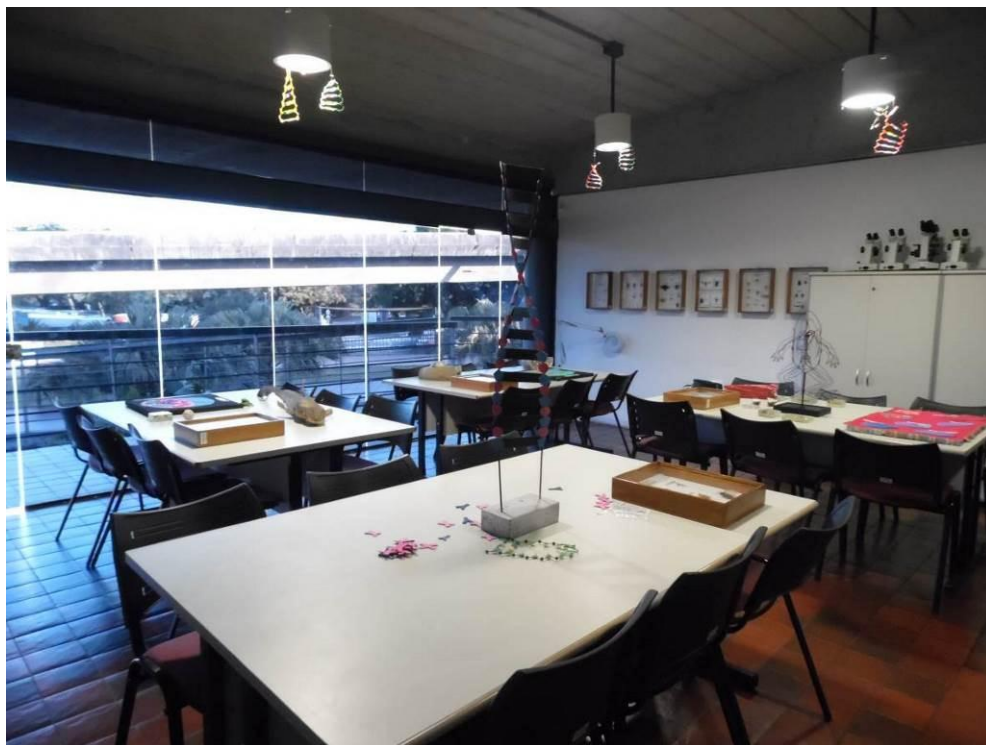
Figura 2: Laboratório de Biologia do Centro Educacional do Espaço Ciência – PE.