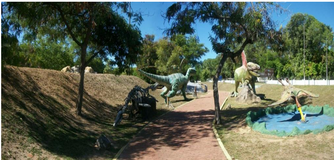
Figura 4: Área Terra – Imagem contendo uma parte de toda a área. Disponível em: < http://www.espacociencia.pe.gov.br/wp-content/uploads/2014/01/Terra-20-1024x402.jpg >. Acesso em: 28 Abr 2016.