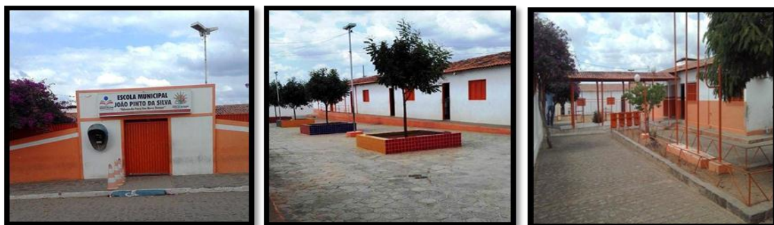
Figura 1 - Escola Municipal de Educação Básica João Pinto da Silva. Barra de São Miguel/PB – 2015