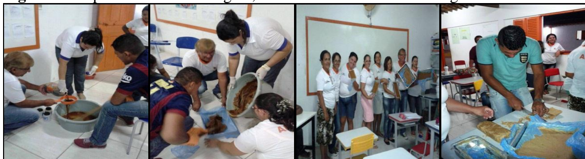
Figura 3. Preparo do sabão ecológico, na EJPS em Barra de São Miguel-PB.