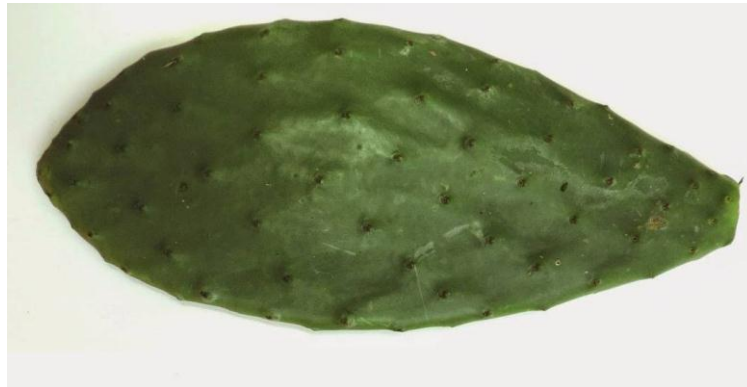
Figura 1: Imagem de um fragmento do cladódio da palma forrageira