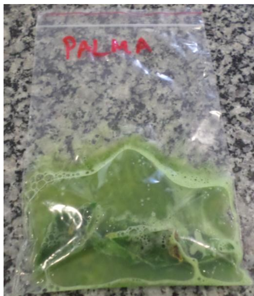
Figura 2: Imagem do material de palma forrageira triturado em reação com a solução extratora

Depois de concluído esse procedimento, o material foi acondicionado em sacos plásticos do tipo “ziplock” e foram adicionados 10 ml da solução extratora de DNA produzida a partir da preparação com 500 ml de água mineral, 30 ml de detergente neutro e 1 (uma) colher de chá contendo cloreto de sódio (sal de cozinha), por um período de 10 (dez) minutos (Figura 2).