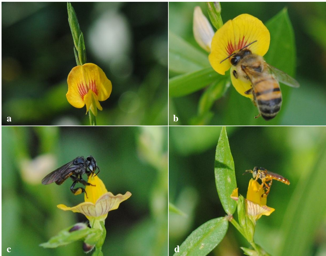
Figura 1. Flor e visitantes florais de Zornia latifolia : a) destaque da flor; b) Apis mellifera coletando néctar; c) Trigona spinipes e d) Tetragonisca angustula pilhando as flores para coleta de pólen.

alguns poucos casos se observe a associação desse tipo de flor com outros grupos de animais (ENDRESS, 1994). Guedes et al., (2009) estudando Canavalia brasiliensis , encontraram uma particularidade morfológica, que se trata da quilha invertida. Nessa espécie, A. mellifera foi considerada pilhadora, provavelmente devido aos atributos morfológicos que não favoreciam o contato com as estruturas reprodutivas. A mesma classificação foi dada no estudo realizado por Meirelles et al., (2015) em Periandra mediterranea . Flores do tipo quilha previnem que as abelhas colem pólen ativamente durante a visita, seja por manipulação e/ou vibração das anteras. Assim, os grãos de pólen aderidos em seus corpos destinam-se à polinização, minimizando o investimento energético dessas espécies (WESTERKAMP, 1997). Apesar de T. angustula e T. spinipes terem apenas coletado pólen, aparentemente a quilha reduziu consideravelmente a extração desse recurso, garantindo pólen para a reprodução através da ação dos polinizadores efetivos.