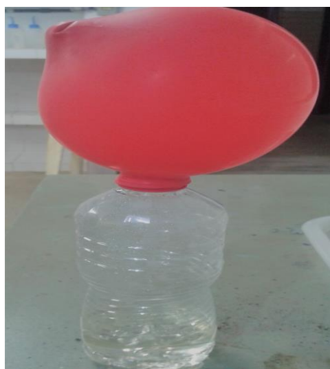
Imagem 1: Experimento “Como encher balões sem usar o ar dos pulmões?”.

Segunda Etapa: execução do experimento “Como encher balões sem usar o ar dos pulmões?” teve como materiais e reagentes: garrafa de plástico; balões; bicarbonato de sódio; vinagre e funil, ilustrado na (Imagem 1). O experimento foi feito colocando-se 100 mL de vinagre na garrafa de plástico; foi colocado 3 colheres de chá de bicarbonato de sódio dentro do balão com o auxílio do funil e prendemos o balão ao gargalo da garrafa.