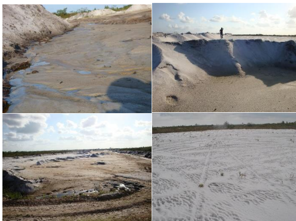
Figura 2 – Mosaico de imagens obtidas nas visitas a lavra de extração de areia

Foram realizadas visitas ao areeiro em questão afim de avaliar localmente os danos causados pela extração exploratória de areia, conforme mosaico ilustrado na Figura 2.