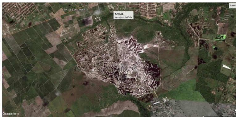
Figura 1: Visão de Satélite da área investigada

os estudos foram concentrados na região das nascentes do Rio Marés, conforme ilustrado na Figura 1.