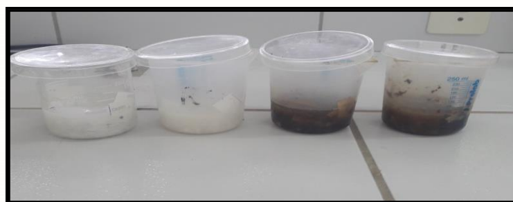
Figura 1. Amostras para medição de pH após 7 dias.

A obtenção do pH aconteceu para os tempos: 0, 15 min, 1 h, 24 h, 7 dias, 14 dias, 21 dias e para 30 dias após a data de preparação de cada amostra. As Figuras 11 e 12 mostram as preparações após 7 dias e a medição do pH de uma das amostras, respectivamente.