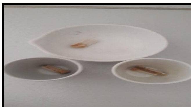
Figura 3. Bitucas após 2 horas de estufa.

As bitucas foram colocadas em cadinhos e cápsulas de porcelana, previamente climatizados, sendo em seguida aferidas suas massas. O material foi aquecido em estufa à temperatura de 100 (\pm 20) ^\circ\text{C} por 2 horas e resfriadas a temperatura ambiente em dessecadores e pesadas em balança analítica. O processo de secagem, resfriamento e pesagem foi repetido até ser obtida massa constante. A Figura 3 mostra as amostras nos cadinhos e cápsulas de porcelana após a secagem na estufa.