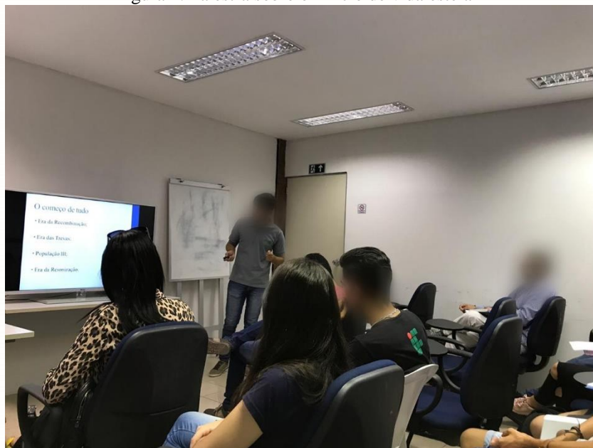
Figura 1: Palestra sobre o “Ciclo de vida estelar”.