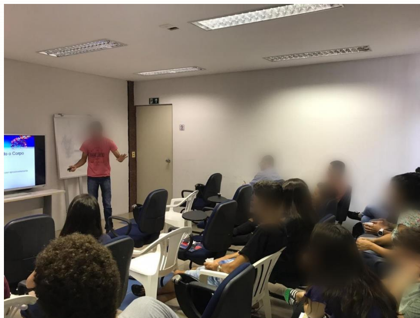
Figura 2: Palestra sobre “A Química do corpo humano”.