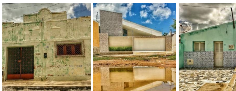
Figuras 24, 25 e 26. Edificação histórica. Residência de alto padrão arquitetônico. Casa porta e janela.

O bairro é composto pelas diversas tipologias edilícias, as primeiras edificações e as que apresentam características de valores históricos concentram-se nas extremidades (figura 24). Próximas às construções antigas estão as de alto padrão arquitetônico (figura 25), que mescla a paisagem local e diversifica a tipologia das edificações da região que, predominantemente, é composto por “casas de porta e janela” (Figura 26).