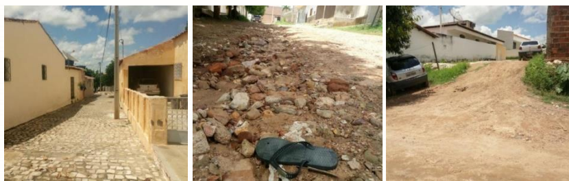
Figuras 03,04 e 05. Infraestrutura viária do bairro.