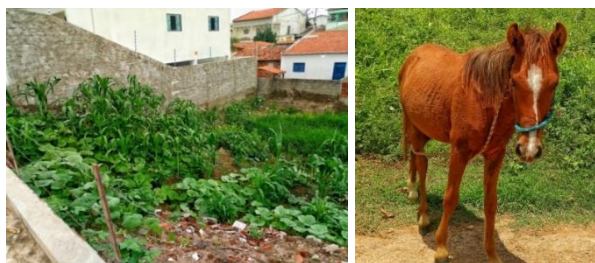
Figuras 30 e 31. Vegetação; Modos rurais