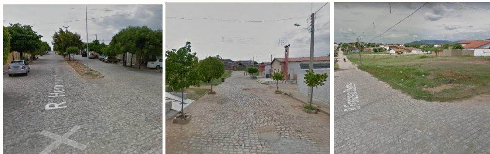
Figuras 10,11 e 12. Rio de tráfego intenso. Ilha de tranquilidade. Interior do bairro.