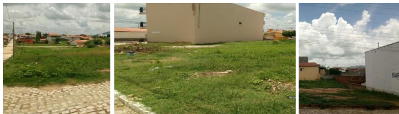
Figuras 15,16 e 17. Terrenos vazios.