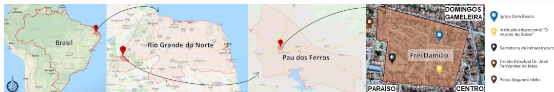
Figura 01. Localização do bairro Frei Damião e seus pontos de referência.