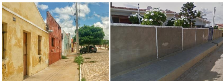
Figuras 13 e 14. Lugares comuns.

Fonte: Acervo dos autores (2018). Google Street View (2012), adaptado pelos autores (2018).