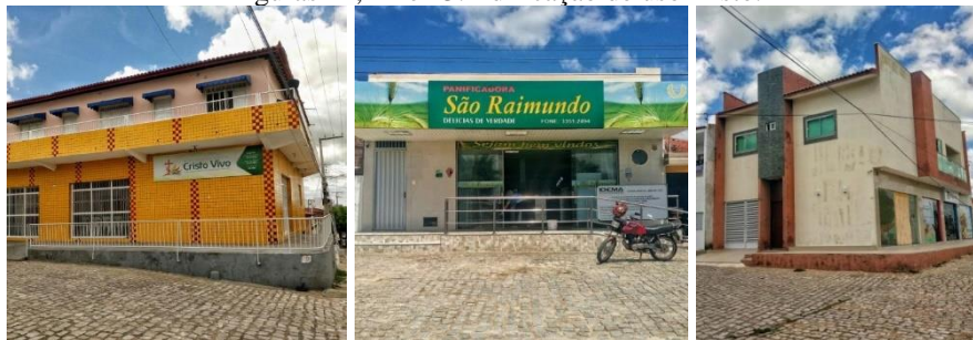
Figuras 21, 22 e 23. Edificação de uso misto.