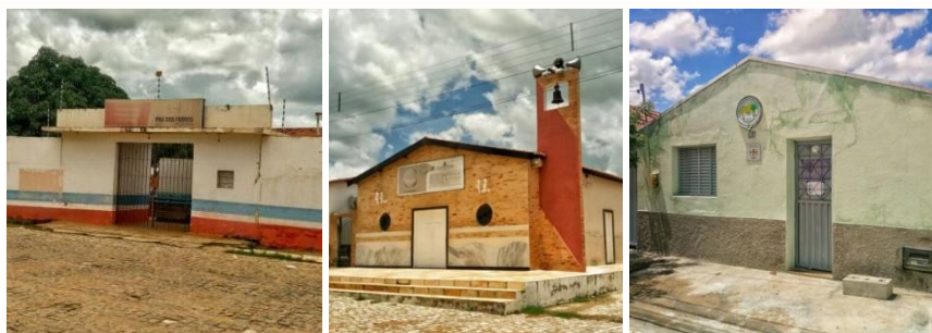
Figuras 18, 19 e 20. Edificações de uso institucional.

Quanto aos demais tipos de uso, institucional, misto e de serviço, seus percentuais são em torno de 9,94%, 3,08% e 0,77% respectivamente, o valor restante 19,69% equivale às vias do bairro. O uso institucional apresentou uma porcentagem maior, em relação a de uso misto e de serviço, devido à grande área ocupada pela Secretaria de Infraestrutura da cidade, somada a demais instituições que dispõem de diferentes áreas, de acordo com suas necessidades (Figuras 18 à 20).